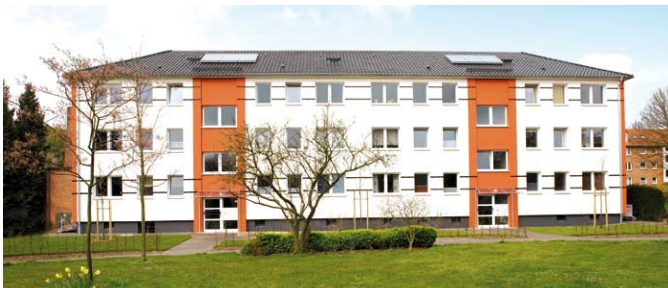
Kiel-Holtenau, Bräutigamweg 9 + 11 (von 1964); Neubaustandard: - 50 %, Energieeinsparung: 80 %